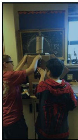
Los Estudiantes Dotados y Talentosos de 6 o grado construyen un satélite