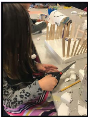
El mercado del 1 er grado